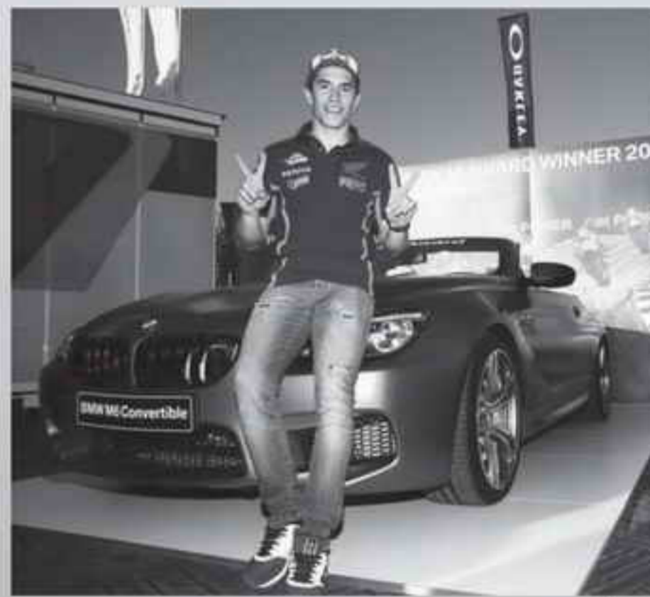
DAPAT MOBIL BMW- Pebalap Repsol Honda, Marc Marquez mendapatkan hadiah mobil setelah jadi pebalap terbaik pada sesi kualifikasi sepanjang musim ini.

"Ini adalah sesuatu, sebuah situasi yang akan membutuhkan waktu selama berbulan-bulan. Tak akan pernah bisa melupakannya, karena kita tak akan pernah lupa. Tapi kita harus menghadapinya," kata Rossi.